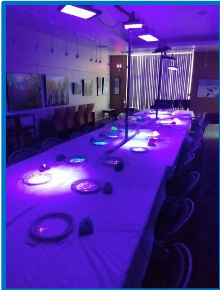
Lieu de l'activité. Un local dans l'obscurité pour l'éclairage ultraviolet. Une espace, de 28 pieds sur 12 pieds, est nécessaire pour placer les tables.